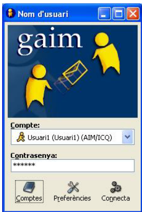
Imatge1: Pantalla principal

Quan arrenquem Gaim per primera vegada se'ns mostrarà una petita finestra. Aquesta pantalla apareixerà buida.